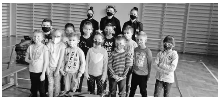
Dzieci poznały zasady udzielania pierwszej pomocy

Młodzieżowa Drużyna Pożarnicza OSP Góra zorganizowała w Szkole Podstawowej im. Stanisława Hadyny we Frydku spotkanie. Młodzi druhowie z MDP przekazywali swoją nabytą wiedzę pierwszej pomocy klasie Ia. Podczas spotkania każdy z nich mógł spróbować