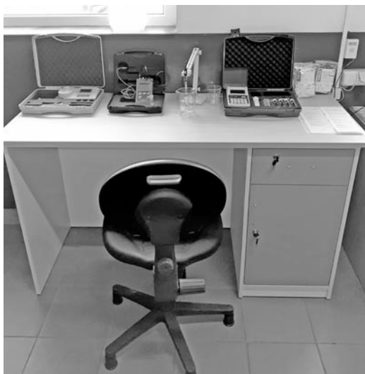
Stanowisko służy do pomiaru jakości wody w gminie

pH-METR CP-411 to urządzenie wykorzystywane do pomiaru pH, mV (potencjał redox) oraz temperatury, które w sposób automatyczny wykrywa wartości pH buforu oraz kompensację temperatury. W zależności od zastosowanej elektrody pH