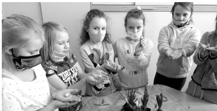
Dzieci przygotowały mini ogródek