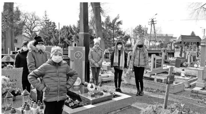
Uczniowie dbają o mogiłę żołnierską