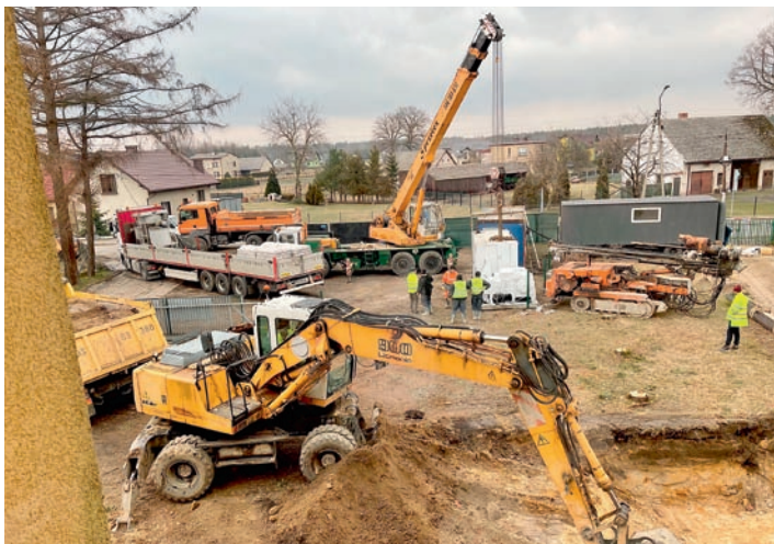
Przy szkole we Frydku trwa palowanie