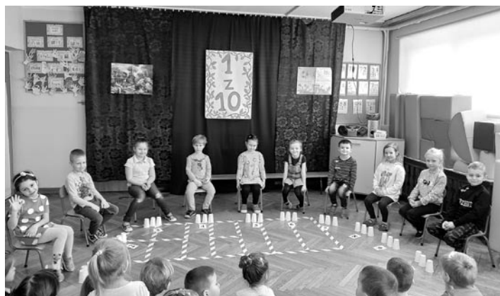
Dla dzieci przygotowano ekologiczne zabawy

W ramach kampanii „Mogę zatrzymać smog – przedszkolak ziąp oddech” Gminne Przedszkole Publiczne im. Marii Kownackiej w Miedźnej otrzymało 2 oczyszczacze powietrza, które sprawnie poprawiają jakość powietrza w salach. Przełom lutego i marca upłynął przedszkolakom pod hasłem „ekologia”. Podczas kolejnych dni dzieci zapoznały się ze sposobami dbania o czystość naszego powietrza i wody. Poznały rów-