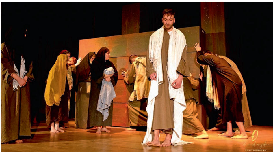
Misterium przedstawili artyści z Chelmka

„Misterium Męki Pańskiej” to coś więcej niż przeżycie artystyczne. Śledząc ostatnią drogę Jezusa Chrystusa mogliśmy przed Świętami Wielkanocnymi, choć na chwilę dostąpić wielkopostnej zadumy i refleksji... »pk