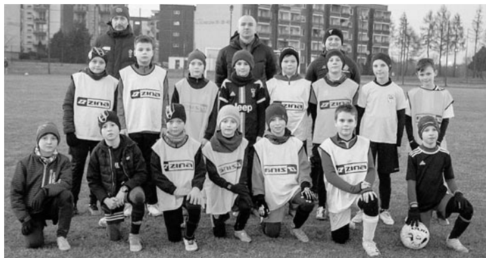
Dzięki współpracy z gminą Miedźna, zajęcia odbywają się na boisku Sokola

Po rozgrzewce przyszedł czas na gry sprawdzające, a do notesów szkoleniowców, którzy będą realizować zajęcia opracowane przez Śląski Związek Piłki Nożnej, po drugim Dniu Talentów trafiły kolejne nazwiska. » SZPN