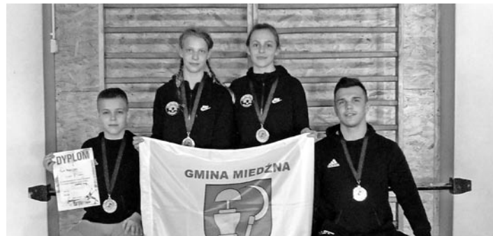
Silna ekipa z Woli podczas zawodów w Bielawie