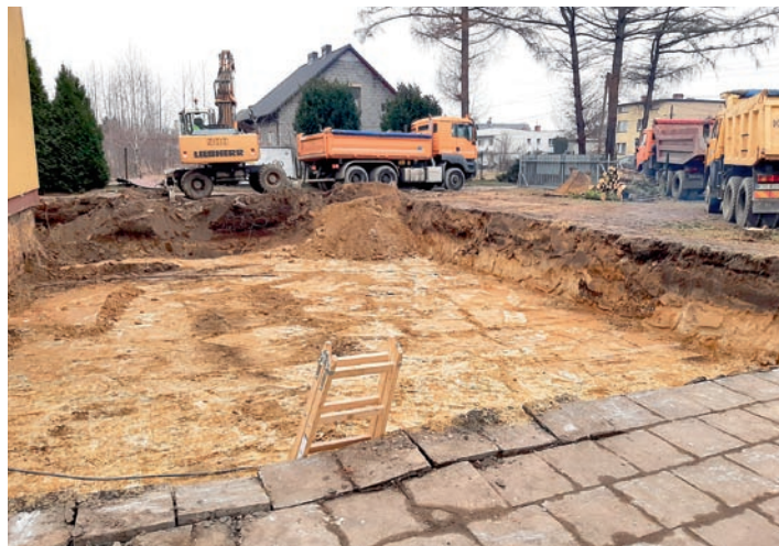
Koszt rozbudowy szkoły we Frydku to ponad 10 mln zł

dydaktyczne wykorzystywane dla potrzeb szkoły, pomieszczenia przedszkola 3-oddziałowego, szatnie dla uczniów, pomieszczenia administracji, techniczne i porządkowe, pomieszczenia higieniczno-sanitarne. W części istniejącej planowana jest rozbudowa budynku w zakresie powiększenia kompleksu kuchennego, przebudowa istniejącej szatni i pomieszczeń magazynowych z zaplecza sali gimnastycznej, dostosowanie pomieszczeń sanitarnych do obowiązujących przepisów i wymogów higieniczno-sanitarnych wraz z kompleksowym remontem istniejącego budynku i przystosowaniem go do przepisów przeciwpożarowych.