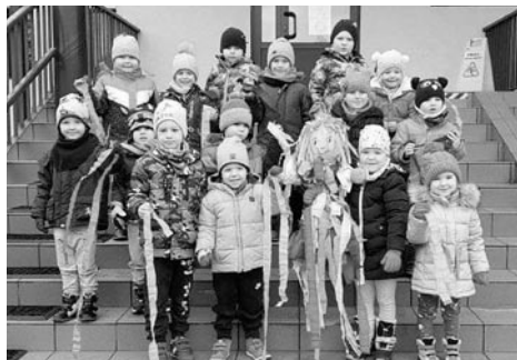
Nadeszła wiosna! Przedszkolaki z naszej gminy radośnie powitały tę porę roku!