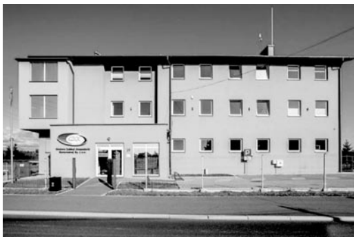
Siedziba GZGK w Gilowicach

Priorytetem jest poprawa jakości wody, która dostarczana jest do mieszkańców. Roczna ocena wody sporządzona przez Państwowy Inspektorat Sanitarny w Tychach dopuszcza wodę do użytku nie warunkowo (jak to było wcześniej), a w pełnym zakresie. A to oznacza, że wodą jest dobrej jakości. Regularnie prowadzone są badania sanepidu oraz wewnętrzny monitoring. W ostatnim czasie przeprowadzono szereg prac poprawiających jakość wody, m.in. zamontowano stację dozowania w przepompowni wody w Górze, zmodernizowano takie stanowiska w Gilowicach i Woli, prowadzone są cykliczne płukania sieci wodociągowej. Co istotne, GZGK odpowiada tylko i wyłącznie za jakość doprowadzanej zimnej wody do mieszkań i wymiennikowi ciepła. Spółka nie jest dostawcą ciepłej wody i nie odpowiada za jej parametry i jakość po podgrzaniu.