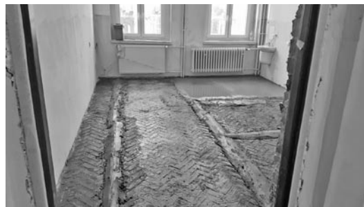
W ZSP w Miedznej powstaną dwa nowe oddziały przedszkolne

W ostatnim czasie zakończył się remont salki przyjęć okolicznościowych i kuchni w budynku przy ul. W. Korfantego 70 w Gilowicach. Jednocześnie GZGK upiększa kolejny teren w gminie. Tym razem nowe nasadzenia pojawiają się przy przedszkolu w Miedznej. ►►