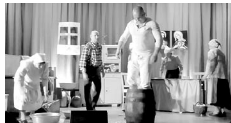
Kadr ze spektaklu, który został zaprezentowany na scenie Domu Kultury w Woli (KADR Z FB)

niańskiego Ula”, nagrody Gminy Miedźna za działalność kulturalną, zaangażowanie w pracę na rzecz kultury, jej upowszechnianie i ochronę. Nagrodzony spektakl można obejrzeć na Facebooku Gminnego Ośrodka Kultury. Celem konkursu organizowanego przez Urząd Marszałkowski Województwa Śląskiego jest wspieranie rozwoju wsi poprzez pobudzanie aktywności gospodarczej czy promocja działań związanych z zachowaniem tradycji oraz wzmacnianiem poczucia tożsamości lokalnej mieszkańców wsi. » pk