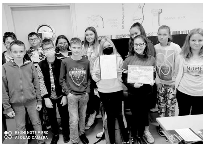
Uczniowie tworzą książkę o budowie ciała