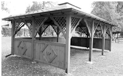
Nowa wiata w Grzawie