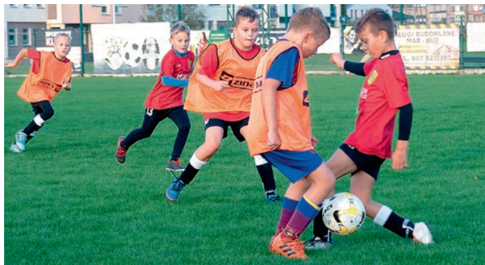
Podczas pierwszych zajęć spotkali się sportowcy z pięciu klubów