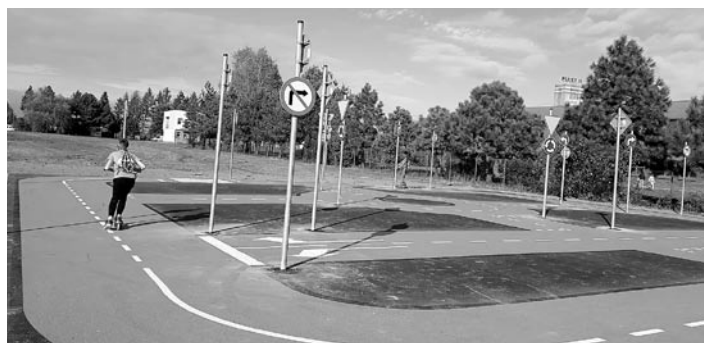
Miasteczko rowerowe w Woli uczy bezpiecznego poruszania się po drogach

Trwa przebudowa na przedszkole pomieszczeń szkoły podstawowej w Zespole Szkolno-Przedszkolnym w Miedznej. Prace prowadzone są w ramach zadania pn. „Podniesienie jakości edukacji przedszkolnej w Gminie Miedzna”. Utworzone zostaną dwa nowe oddziały przedszkolne wraz z pomieszczeniami towarzyszącymi i pomocniczymi (jadalnia, sala gimnastyczna, szatnia, pomieszczenie logopedy, pokój nauczycielski, pomieszczenie administracji, zaplecze socjalne oraz zaplecze sanitarne). Zostaną również przebudowane schody zewnętrzne wejściowe do budynku przedszkola, a także wykonana