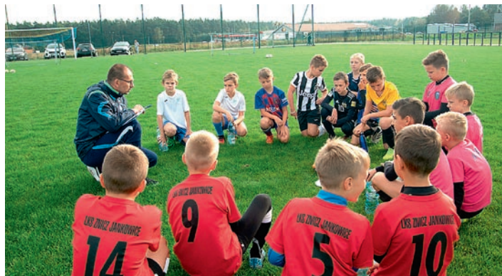
Treningi odbywają się na stadionie Sokola w Woli

8 października na boisku LKS Sokół Wola wystartował bezpłatny program „Śląska Akademia Piłkarska dla Wyrównywania Szans Piłkarskiego Rozwoju w Podokręgach”.