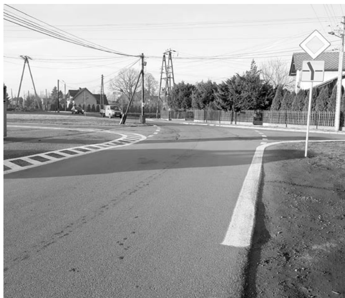
Nowe oznakowanie w rejonie ul. Różanej w Woli

Trwają prace w szkole w Miedźnej, gdzie część pomieszczeń zostanie zaadaptowanych na przedszkole. W ramach