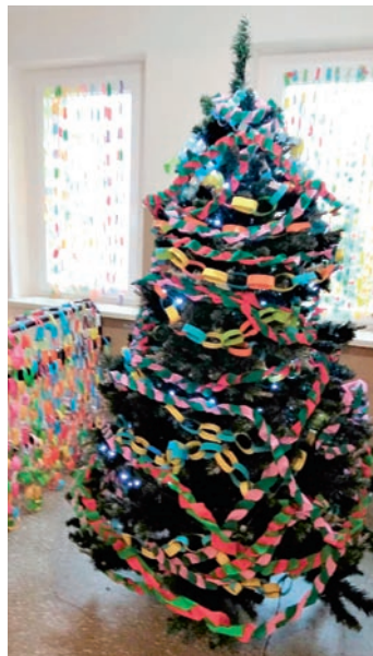
Jedna z choinek w Gminnym Ośrodku Kultury z konkursowymi łańcuchami (FOT. GOK)

Na okres świąteczny w gminie pojawiły się piękne iluminacje i dekoracje. Także przygotowane przez samych mieszkańców!