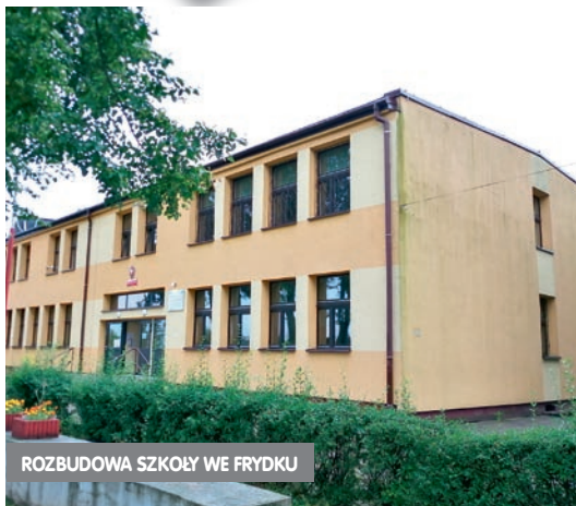
ROZBUDOWA SZKOŁY WE FRYDKU

MIESIĘCZNIK GMINY MIEDŹNA | Nr 1 (80), STYCZEŃ 2021 | Cena: 1 zł (w tym 8% VAT)