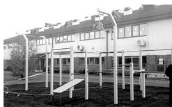
Park do ćwiczeń street workout powstał za basenem

Okolice Krytej Pływalni w Woli sukcesywnie oferują coraz więcej aktywności. Niedawno otwarto miasteczko rowerowe, wcześniej pojawiły się tam stoliki do