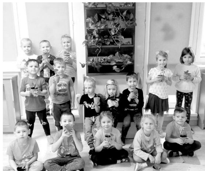
Dzieci prezentują ściankę zieleni