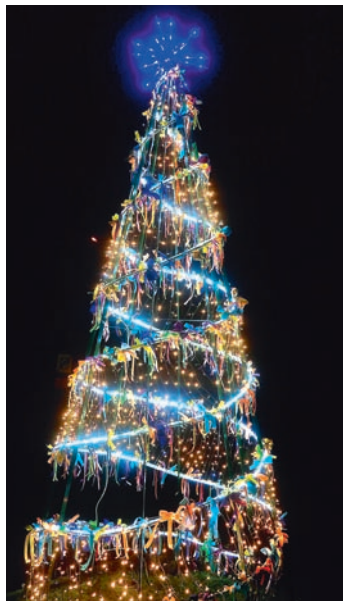
Część ozdób konkursowych zdobi choinkę na parkingu przy Centrum Kultury