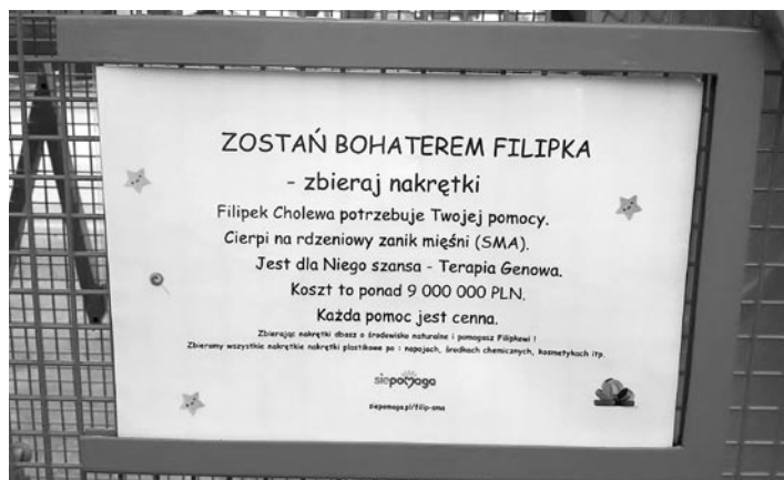
Nakrętki – w tak prosty sposób można pomóc!