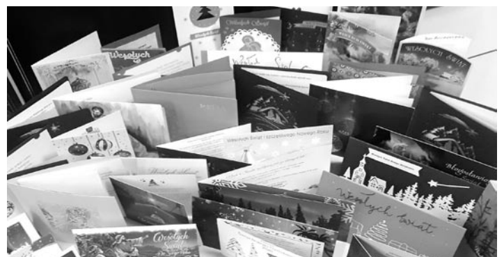
Dziękujemy za wszystkie życzenia świąteczne oraz noworoczne, które wpłynęły do Urzędu Gminy Miedzna! Mamy nadzieję, że choć część z tych życzeń w naszej gminie się spełni