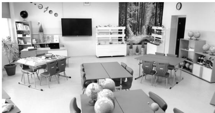
Uczniowie będą mogli korzystać z nowoczesnej pracowni

Szkoła Podstawowa nr 1 w Woli ma nową pracownię. Powstała ona w ramach realizowanego projektu „Zielony Zakątek Śląska”, na który szkoła otrzymała dotację z Wojewódzkiego Funduszu Ochrony Środowiska i Gospodarki Wodnej w Katowicach w wysokości 30 tys. zł.