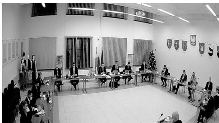
Sesja budżetowa odbyła się 22 grudnia

Radni jednogłośnie opowiedzieli się za przyjęciem budżetu gminy na rok 2021 (15 głosów „za”). Podczas grudniowej sesji Rada Gminy przyjęła także Wieloletnią Prognozę Finansową Gminy Miedźna na lata 2021-2029, również jednogłośnie. Obie uchwały uzyskały wcześniej pozytywne opinie Regionalnej Izby Obrachunkowej oraz branżowych komisji Rady Gminy.