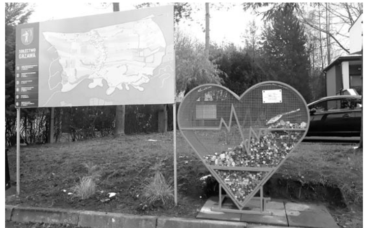
Jedno z serc znajduje się w Grzawie

Teraz wszystko w naszych rękach – jak szybko serca będą się zapełniały. Tak niewiele może pomóc! » pk, UG