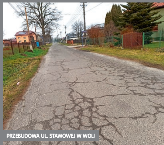
PRZEBUDOWA UL. STAWOWEJ W WOLI