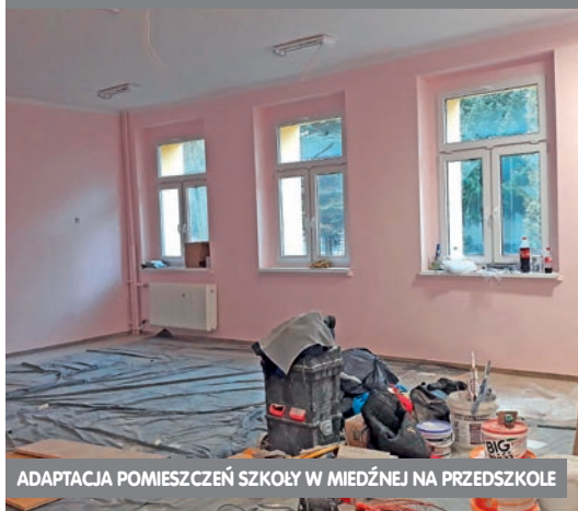
ADAPTACJA POMIESZCZEŃ SZKOŁY W MIEDŹNEJ NA PRZEDSZKOLE