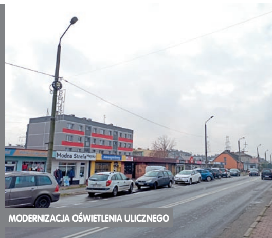
MODERNIZACJA OŚWIETLENIA ULICZNEGO