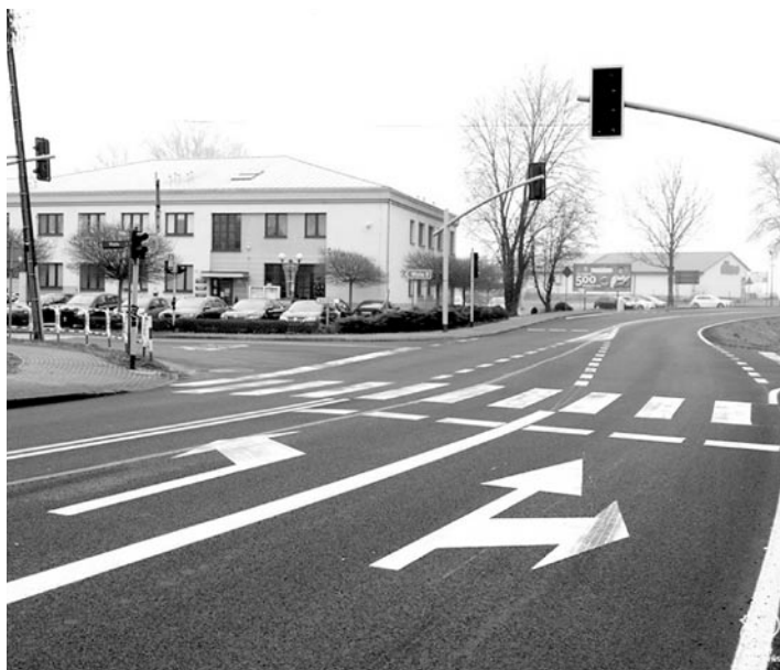
Skrzyżowanie przy Urzędzie Gminy po remoncie