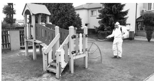
Dezynfekcja placu zabaw we Frydku

Zeby dzieci mogły bawić się w bezpiecznych warunkach, a starsi bezpiecznie ćwiczyć i odpoczywać gmina kupiła