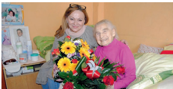
Solenizantkę odwiedziła dyrektor Gminnego Ośrodka Kultury