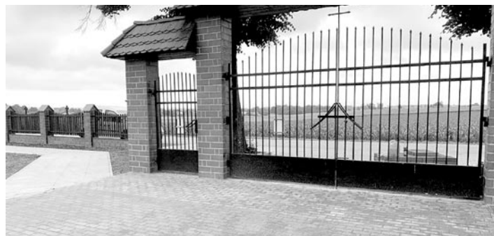
Prace wykonano na wniosek mieszkańców

Zakończyły się prace na cmentarzu komunalnym w Górze. Usunięte zostały tam bariery architektoniczne.