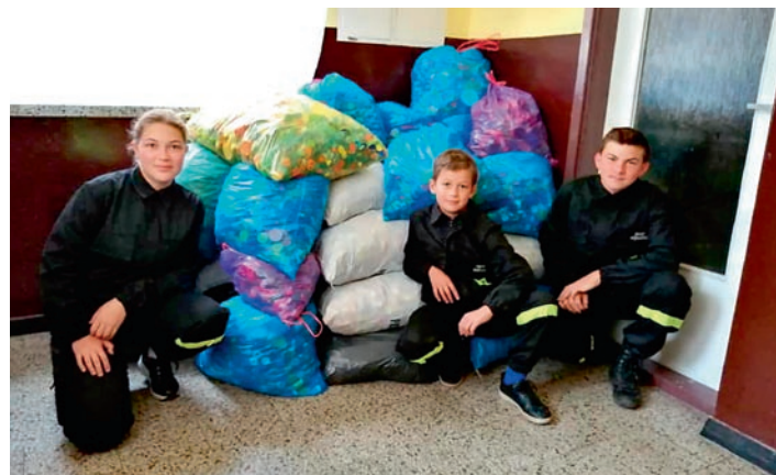
Nakrętka – niby mała, zwykła rzecz. A może pomóc!

Jak zwykle mieszkańcy gminy pokazali wielkie serce. Dzięki temu udało się zbierać kilkadziesiąt worków pełnych nakrętek. O dziewczynkach pisaliśmy wcześniej na łamach „Gminnych Spraw”. Kilkakrotnie już organizowano akcje charytatywne, podczas których zbierano środki wspierające ich leczenie. » pk