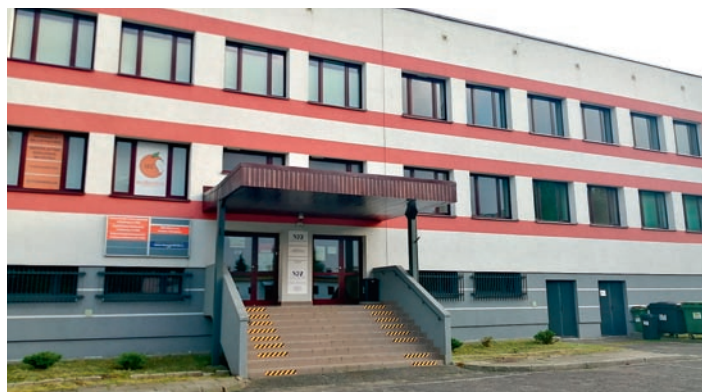
Od 2014 r. część obiektu jest pusta. Czy tym razem uda się wynająć pomieszczenia?

Rada Gminy wyraziła zgodę (11 głosów „za”, 3 głosy wstrzymujące się) na odstąpienie od obowiązku przetargowego trybu zawarcia umowy najmu lokalu użytkowego. To pierwszy krok ku temu, żeby pomieszczenia wynająć podmiotowi mającemu siedzibę w naszej gminie,