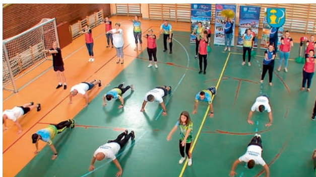
Miedźna robi pomпки w szczytnym celu

Inicjatywę #GaszynChallenge zapoczątkowali strażacy z miej-