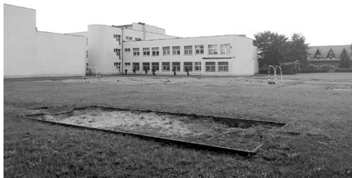
Przy Zespole Szkół w Woli powstanie nowoczesne boisko wielofunkcyjne

Nowe boisko wielofunkcyjne z nawierzchnią poliuretanową, elastyczną zostanie wybudowane w miejscu istniejącego boiska przyszkolnego o nawierzchni asfaltowej. Będzie miało wymiary 32 x 33,5 m. W tym obszarze zlokalizowane zostaną boisko do gry w piłkę nożną o wymiarach: 28 x 29,5 m wyposażone w dwie demontowane bramki, boisko do gry w koszykówkę o wymiarach 28 x 15 m wyposażone w dwa stacjonarne kosze, dwa boiska do gry w siatkówkę o wymiarach