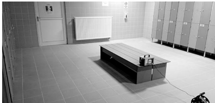
Nocne ozonowanie w obiektach GOSiR

Na terenie obiektu obowiązuje zastrzeżenie ust i nosa przez użytkowników, z wyłączeniem pływania w basenie, ćwiczenia w siłowni – osłona ust i nosa powinna być zdjęta i pozostawiona wraz z ubraniem w szatni. Ubierając się po kąpieli/ćwiczeniach należy ponownie założyć osłonę ust i nosa w szatni i niezwłocznie opuścić obiekt. Nie ma