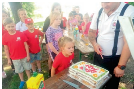
1 czerwca Młodzieżowa Drużyna Pożarnicza OSP Góra obchodziła rok istnienia. Przez ten czas młodzi strażacy wykazali się dużym zaangażowaniem i poświęceniem!