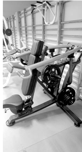
Nowy sprzęt kosztował ponad 21 tys. zł

Aby ćwiczenia było jeszcze przyjemniejsze kupiono nowy głośnik i podłączono w-fi. Wszystko to kosztowało ponad 21 tys. zł. ➔ UG