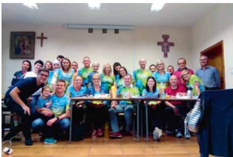
Pierwszy rok działalności świętował też klub „PoWoli do celu”. To grupa, która wspaniale promuje aktywne spędzanie wolnego czasu, angażując się w wiele gminnych imprez