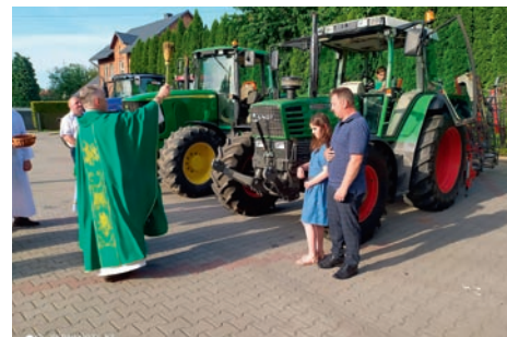
13 czerwca parking przy kościele pw. św. Klemensa w Miedźnej zapełnił się imponującym sprzętem rolniczym. Wtedy bowiem odbyło się poświęcenie maszyn rolniczych