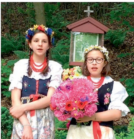
Najmłodsze reprezentantki Zespołu Śpiewaczego „Górzanie” podczas festiwalu (FOT. KADR Z FILMU)