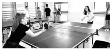
Zawody zorganizowano po raz 13.