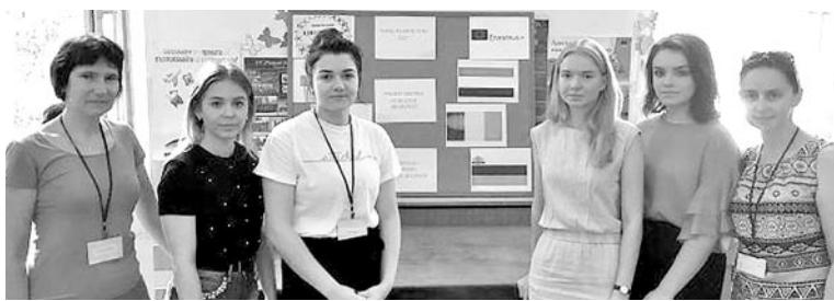
Podczas spotkania w Bułgarii