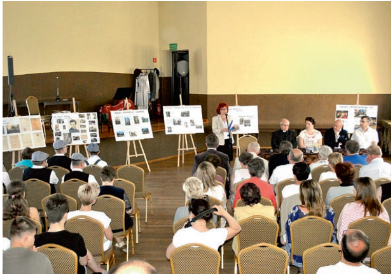
Konferencja cieszyła się dużym zainteresowaniem mieszkańców i uczniów