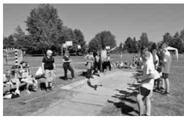
Uczniowie sprawdzali się m.in. w konkurencjach lekkoatletycznych

Zawodnicy zostali podzieleni na dwie kategorie wiekowe: młodszą (klasy 4, 5,