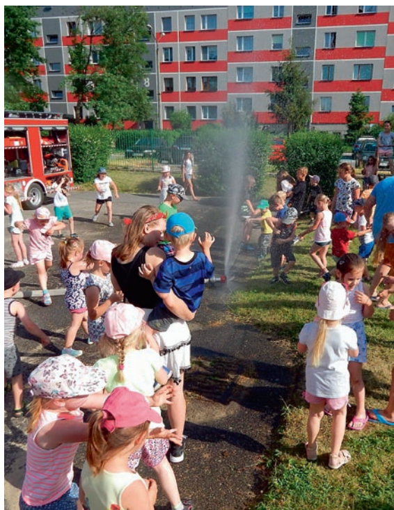
Podczas pikniku przy Gminnym Przedszkolu Publicznym nr 2 w Woli 12 czerwca