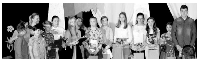
W konkursie udział wzięło 59 uczniów