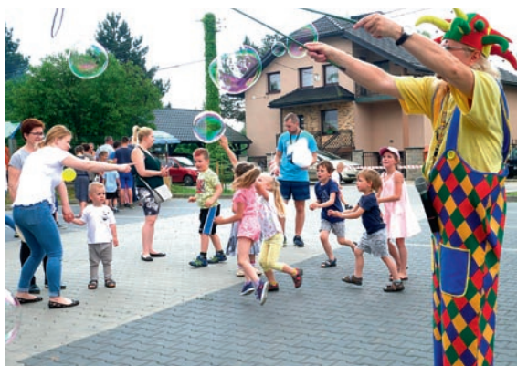
Zabawa przy Zespole Szkolno-Przedszkolnym w Miedźnej, 1 czerwca

W czerwcu w gminie Miedźna odbyły się kolejne plenerowe pikniki rodzinne. Przygotowano mnóstwo atrakcji dla całych rodzin!