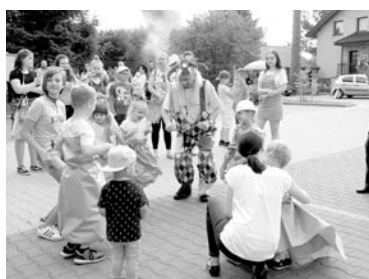
Podczas pikniku przygotowano wiele atrakcji

Organizatorami imprezy byli Zespół Szkolno-Przedszkolny w Miedźnej, Rada Sołectwa z Miedźnej i Grzawy, Rady Rodziców szkoły i przedszkola. Piknik rozpoczął się od podchodów, które prowadziły malowniczą trasą po okolicy. Wodzirej – klaun czuwał nad atrakcjami, prowadząc szereg zabaw zwłaszcza dla najmłodszych. Kolejne atrakcje były związane z loterią fantową, w której każdy los był wygrany. Malowanie twarzy i układanie fryzur to atrakcje cieszące się dużym powodzeniem. Były też dmuchane zamki i węże dla najmłodszych oraz krowa z pysznym mlekiem do dojenia. Na boisku można