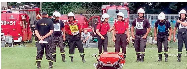
W rywalizacji udział wzięli strażacy z czterech jednostek OSP