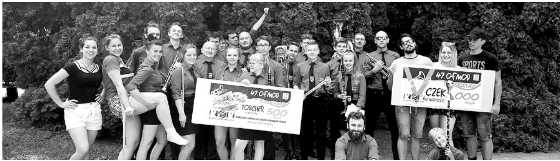
Członkowie orkiestry z nagrodą po festiwalu w Inowrocławiu