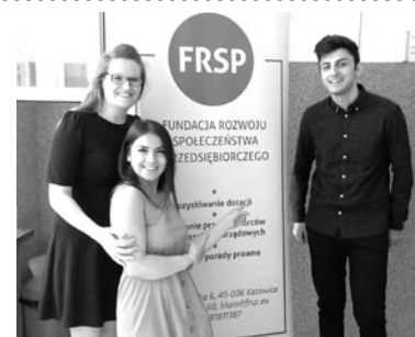
Podczas wernisażu, który odbył się 19 czerwca