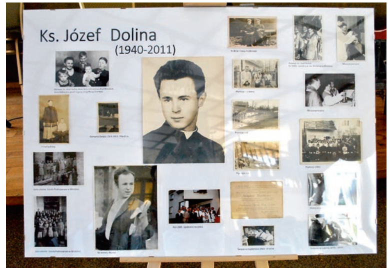
Przygotowano też wystawę archiwalnych zdjęć i dokumentów osób, które przedstawiano