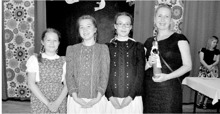
„Wolanka” trafiła m.in. do zespołu „Młode Pszczynioki” z SP nr 2 w Pszczynie