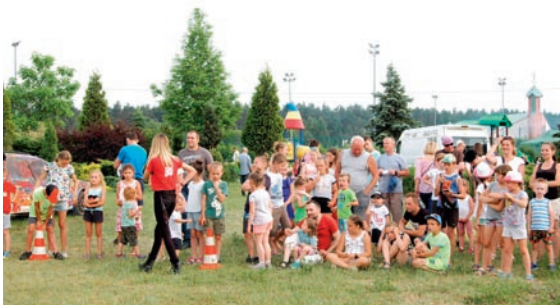
Wspaniała atmosfera panowała na pikniku zorganizowanym w Grzawie 29 czerwca