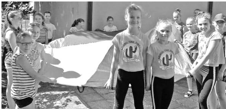
Dzieci wzięły udział w zabawach i konkurencjach sportowych