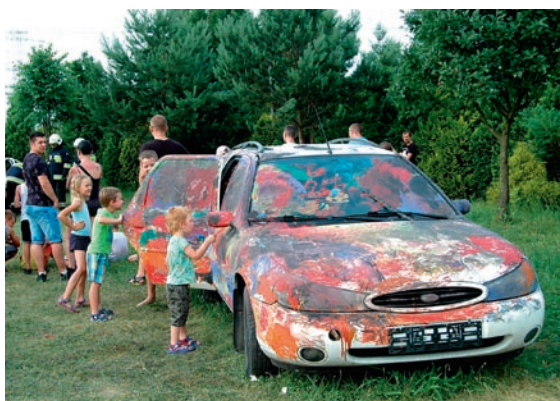
Podczas pikniku przy Zespole Szkolno-Przedszkolnym w Woli 15 czerwca dzieci mogły wykazać się kreatywnością (FOT. ZSP WOLA)