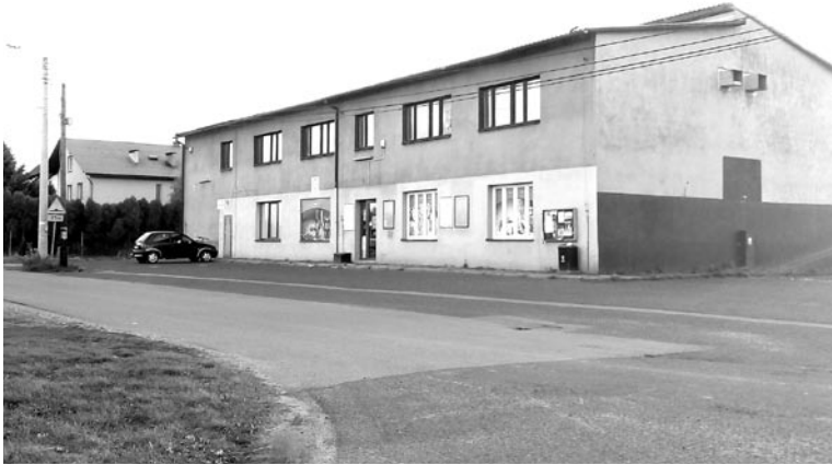
Jest pomysł, by w tym miejscu powstał nowy budynek, siedziba OSP Wola