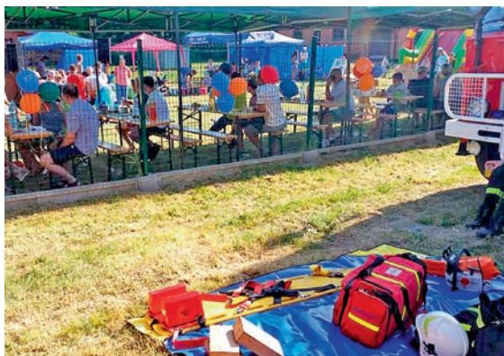
Wspaniała atmosfera panowała na pikniku zorganizowanym w Grzawie 29 czerwca