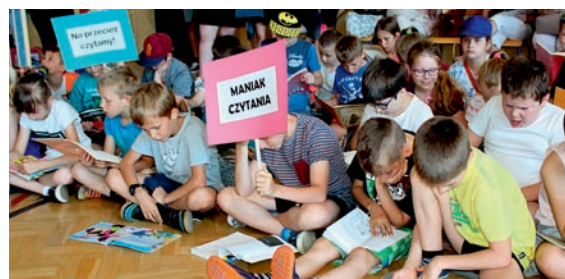
Podczas otwarcia odbyła się akcja bicia rekordu masowego czytania w jednym momencie