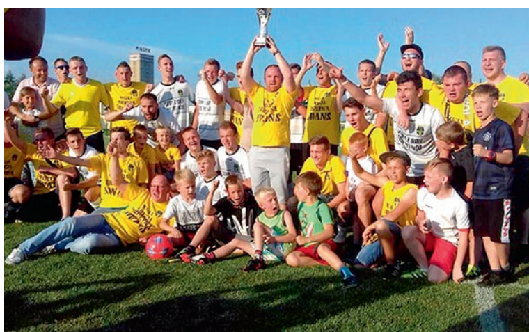
Sokół Wola świętuje awans do okręgówki