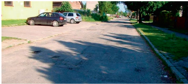
Przebudowa ul. Krótkiej w Woli pochłonie ponad 200 tys. zł