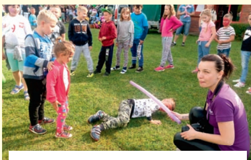
Piknik przy SP nr 2 w Woli, 10 czerwca