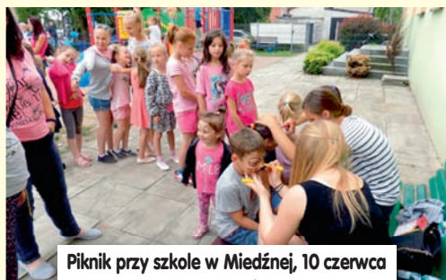
Piknik przy szkole w Miedznej, 10 czerwca