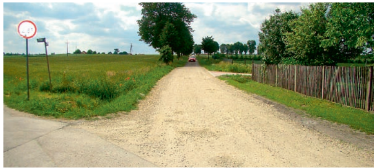
Już wkrótce ul. Cmentarna w Górze będzie jak nowa

ników najazdowych, zabudowę dodatkowych studzienek ściekowych wraz z ich włączeniem, przebudowę istniejących studzienek ściekowych wraz z przykanalikami, wykonanie warstwy wiążącej oraz ścieralnej, uzupełnienie pobocza kruszywem łamanym i humusem, odtworzenie nawierzchni zjazdów, chodników i dojeżdżalni oraz regulację wysokościową parkingu i urządzeń obcych. Na wykonanie wszystkich prac remontowych wykonawca ma czas do 31 lipca.