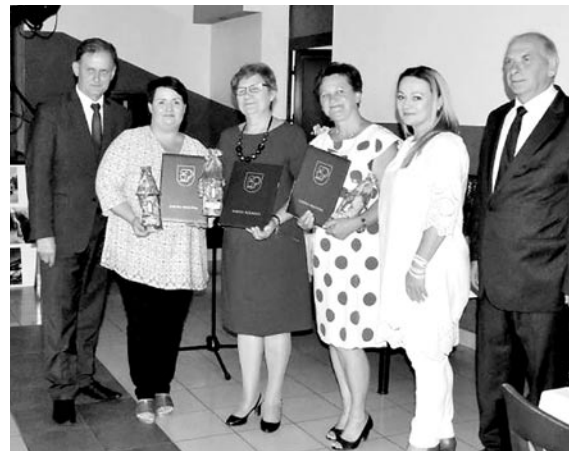
Nagrody wręczono 29 czerwca