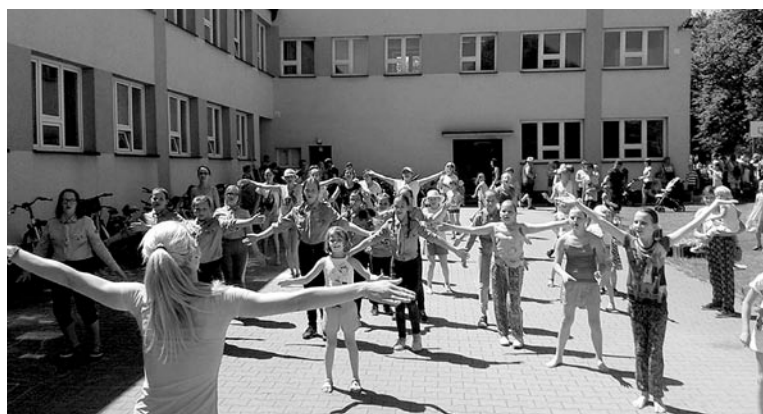
Wspólna zabawa podczas pikniku, który odbył się po zakończeniu rajdu