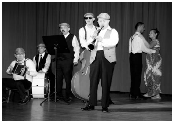
Podczas uroczystej sesji zaprezentowała się m.in. „Podwórkowa kapela nie z wesela”, podopieczni Środowiskowego Domu Samopomocy