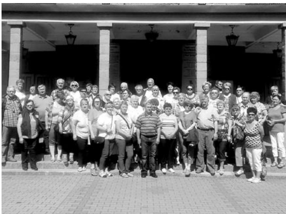
Podczas jednej z wycieczek

Organizatorzy przyznają, że zaplanowane imprezy cieszą się taką popularnością, że brakuje miejsc dla wszystkich chętnych. Do końca roku zaplanowano jeszcze sporo innych atrakcji. W dniach 2–4 sierpnia planowana jest wycieczka w Bieszczady (koszt – 430 zł od osoby), a we wrześniu – 14-dniowe wczasy nad morzem w Jastarni (w dniach 4–18 września, koszt – 1 520 zł). 27 września w Miedznej ma odbyć się walne zebranie sprawozdawczo-wyborcze. 4 października organizowana jest jednodniowa wycieczka na grzyby do Korbielowa (koszt – 70 zł), a w dniach 8–9