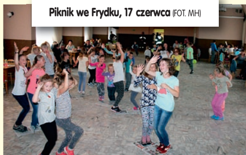
Piknik we Frydku, 17 czerwca