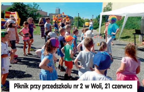
Piknik przy przedszkolu nr 2 w Woli, 21 czerwca