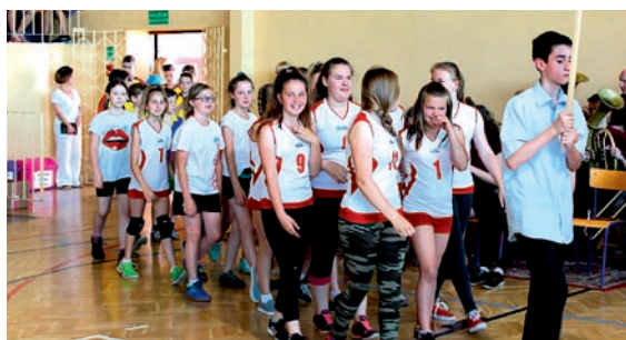
W zawodach udział wzięło 430 uczniów

Konkurencje sportowe odbywały się na wielu obiektach: w sali gimnastycznej gimnazjum zmagali się siatkarze, na boisku szkolnym – lekkoatleci, w szkole podstawowej grano w tenisa stołowego. Przygotowano także konkurencje dla uczniów niepełnosprawnych ze szkół oraz podopiecznych Środowiskowego Domu Samopomocy z Grzawy. Piłkarze rywalizowali na Orliku, a pływacy, w tym także członkowie Stowarzyszenia Start z Katowic, na