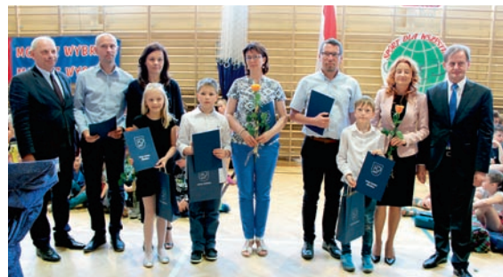
Zawody były też okazją do nagrodzenia wyróżniających się sportowców, uczniów, ich nauczycieli, trenerów oraz rodziców