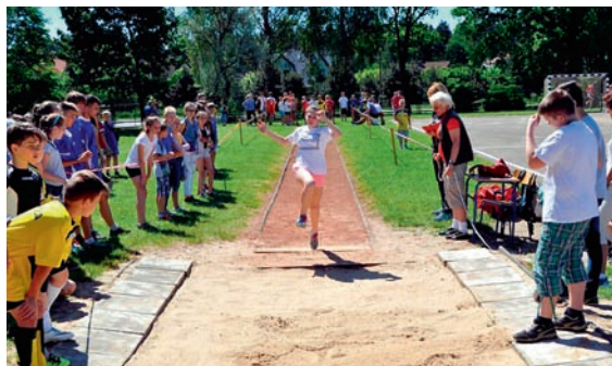
Uczniowie rywalizowali w różnych dyscyplinach