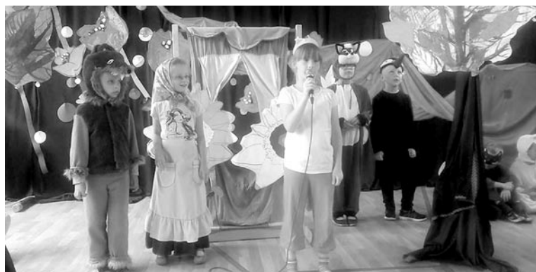
Uczniowie zaprezentowali 5 spektakli