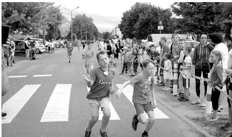
Biegi zorganizowano po raz 27.