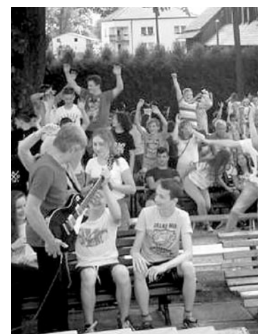
Uczniów poprzez zabawę przekonywano do zdrowego stylu życia

Po koncercie wszyscy uczniowie udali się najpierw na pokaz fryzjerski i później na Orlika, aby wziąć udział