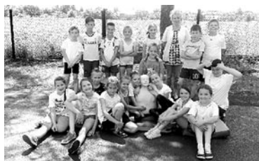
Oto mali ratownicy – uczniowie szkoły we Frydku

W ostatnim tygodniu nauki szkolnej uczniowie klas trzecich SP we Frydku kolejny już raz doskonalili swoje umiejętności udzielania pierwszej pomocy. Pracując z wychowawcami i pielęgniarką szkolną praktycznie sprawdzali nabyte w klasie I i II przygotowanie do niesienia pierwszej pomocy. Ćwiczyli na sobie układanie nieprzytomnego i oddychającego w pozycji bocznej ustalonej. Było przy tym wiele śmiechu i zabawy, przez co nauka była przyjemniejsza. To zadanie nie sprawiało im żadnego problemu. Wykazali się doskonałą znajomością numerów alarmowych. Odważnie prowadzili