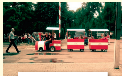
Piknik w Górze, 15 czerwca