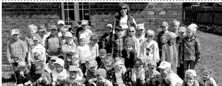
Przedшкоlaki przed kapliczką w Gilowicach