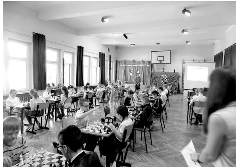
W zawodach udział wzięło 38 uczniów