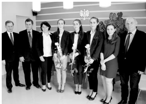
Podczas urodzinowego spotkania w Urzędzie Gminy