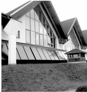
Na basenie pojawiło się 68 kolektorów słonecznych

Na Krytej Pływalni w Woli zamontowano już solary. Wkrótce ruszy ich montaż na domach jednorodzinnych.