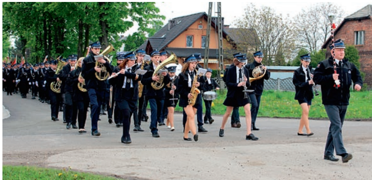
Obchody rozpoczęto mszą św., po której uczestnicy wraz z orkiestrą „Silenzio” przemarszerowali pod remizę

Strażaków–ochotników w powiecie pszczyńskim jest ponad 1 500. Dzięki nim możemy czuć się bezpiecznie. Zawsze spieszą na pomoc innym. W drugą sobotę maja dziękowano za ich poświęcenie i pracę, a także świętowano jubileusz OSP Góra.