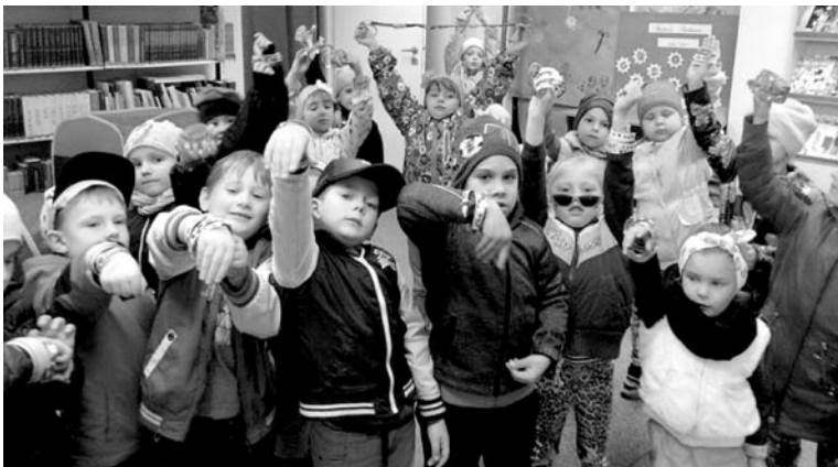
Podczas jednych z zajęć z przedszkolakami

Dla gimnazjalistów przygotowano warsztaty scenariuszowe, które poprowadził Zbigniew Masternak. W trakcie zajęć omówiono najważniejsze zagadnienia związane z produkcją filmu. Uczniowie, pracując w zespołach dwuosobowych, przygotowywali screeny, które zostały odczytane na koniec zajęć. » GBP