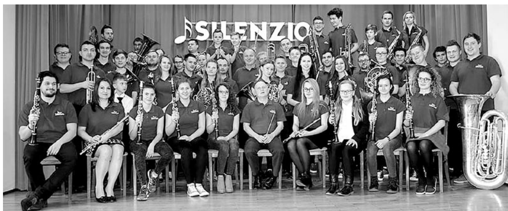
Płyta zawierać będzie 12 nagrań