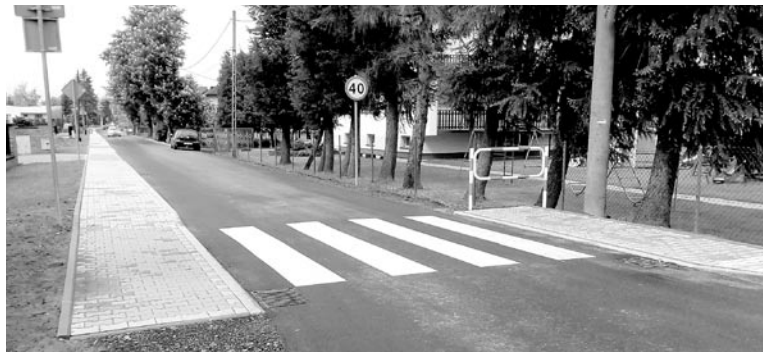
Ulice Kasztanowa i Kręta w Górze zostały przebudowane, dodatkowo przy przedszkolu pojawił się nowy chodnik (FOT. PK)

Zakończyła się realizacja zadania pn. „Poprawa warunków komunikacyjnych oraz bezpieczeństwa poprzez przebudowę dróg gminnych – ul. Kasztanowej i ul. Krętej w Górze wraz z budową chodnika”.