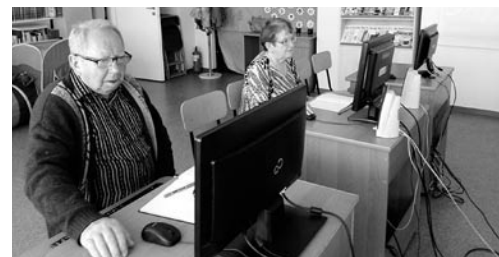
Seniorzy podczas zajęć