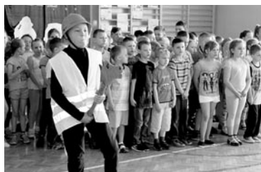
Uczniowie dla strażaków przygotowali przedstawienie