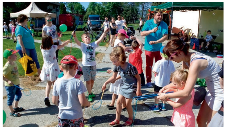
28 maja na placu obok świetlicy na osiedlu Wola II odbył się festyn rodzinny „Postaw na rodzinę”. Imprezę zorganizowali Rada Sołecka Wola II oraz świetlica Gminnego Ośrodka Kultury. Dla dzieci przygotowano sporo atrakcji, m.in. zabawy z wodzirejem, dmuchańce, rodzinne konkurencje, zjeżdżalnię czy bańki mydlane. Piknik był współfinansowany z Gminnego Programu Profilaktyki i Rozwiązywania Problemów Alkoholowych Gminy Miedźna na rok 2017. (FOT. PK)