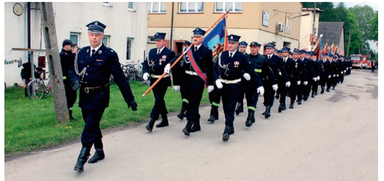
Do Góry przyjechali strażacy–ochotnicy z trzech województw, a także delegacja z Austrii

Podczas uroczystości wręczono odznaczenia i medale dla wyróżniających się członków ochotniczych straży pożarnych. Po zakończeniu części oficjalnej był czas na zabawę. Wystąpiła