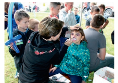
Nie brakowało atrakcji dla najmłodszych. Gminny Ośrodek Kultury zaprosił m.in. na malowanie twarzy

orkiestra „Silenzio”, częstowano strażacką grochówką. Gminny Ośrodek Kultury przygotował sporo atrakcji dla dzieci. Były dmuchańce, zabawy sporto-