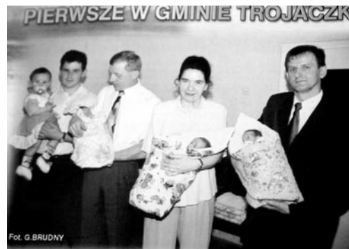
To zdjęcie sprzed 18 lat, które po narodzinach trojaczek ukazało się w ówczesnych „Gminnych Sprawach”