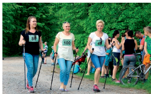
Wystartowały 173 osoby, w tym 42 w kategorii nordic walking