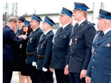
Podczas uroczystości wręczono odznaczenia i medale dla wyróżniających się członków ochotniczych straży pożarnych