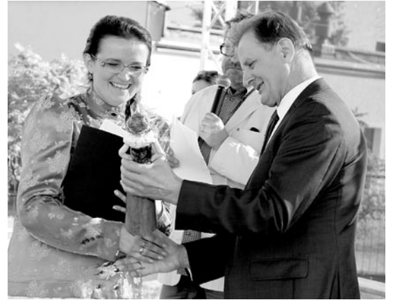
„Wolanka” w kategorii dorosłych powędrowała do Ćwiklic i zespołu „Ćwikliczanie”

18 zespołów zaprezentowało się podczas XXIII Regionalnego Festiwalu Folklorystycznego Dorosłych, XXII Regionalnego Festiwalu Folklorystycznego Dzieci i Młodzieży wraz z IX Paradą Ludowego Stroju Śląskiego „Jak Cie widzom, tak Cie pizom”.