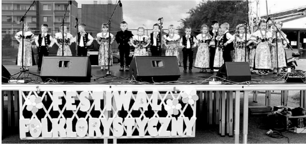
Wśród młodych wykonawców wygrały „Knefliki” z GPP nr 2 w Woli