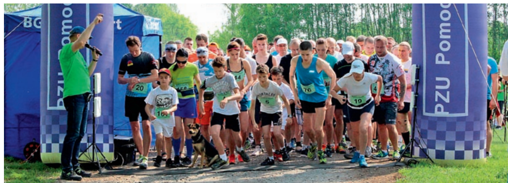
Start i meta były obok leśniczówki w Woli