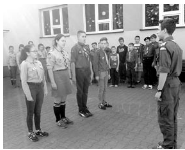
Podczas spotkania harcerzy z Góry i Brzeszcz

Podczas majowego harcowania w Górze pochyłono się nad problemem braterstwa i tolerancji. Wspólne dla harcerzy z Góry i Brzeszcz są harcerskie wartości, zwyczaj i piosenki, ale inne miejscowość, drużyna, szkoła oraz region kraju. Podczas spotkania harcerze konfrontowali ulubione dyscypliny sportowe, płyś harcerskie, wiedzę o swoich