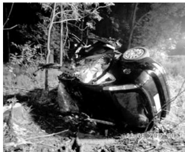
Samochód został kompletnie zniszczony, ale 18-latkowi nic poważnego się nie stało

O szczęściu w nieszczęściu może mówić 18-latek mieszkaniec Miedźnej. Mężczyzna z wyglądającego makabrycznie wypadku wyszedł niemal bez szwanku.