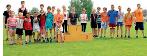
Najmłodszy uczestnicy imprezy otrzymali upominki